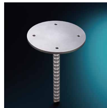
ベースアダプター

既設の地中埋込式ポールの 改良時のアダプターとして使用 付属アンカーボルト2本使用施工よりも 強固に設置したい場合に推奨