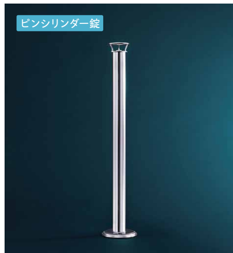
ピンシリンダー錠