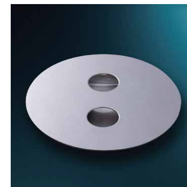
ベースプレートカバー

ベースプレート中央開口部の 小石、粉塵詰まり防止ほか アンカーボルトの 目隠しとして使用