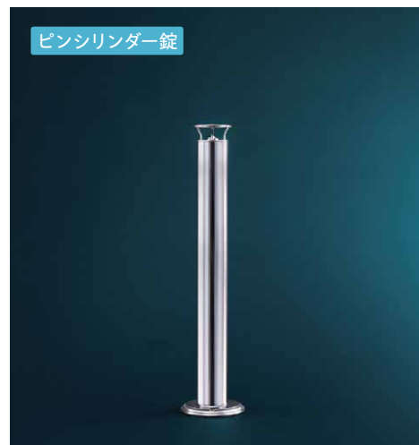
ピンシリンダー錠