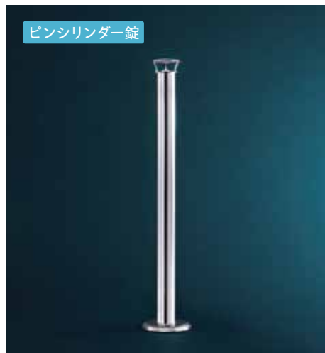
ピンシリンダー錠