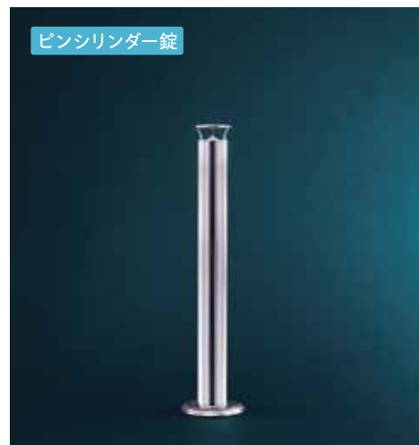
ピンシリンダー錠