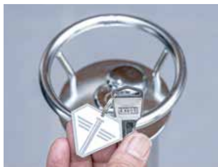
ピンシリンダー錠

●いたずら防止ビス使用 (鍵番号はランダム出荷となります) ※キーホルダーは付属しません