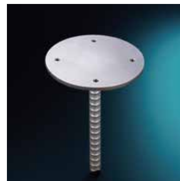
ベースアダプター

既設の地中埋込式ポールの 改良時のアダプターとして使用 付属アンカーボルト2本使用施工よりも 強固に設置したい場合に推奨