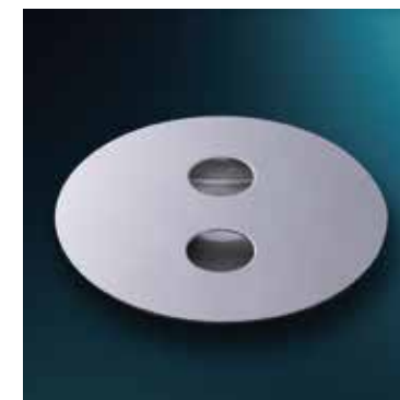
ベースプレートカバー

ベースプレート中央開口部の 小石、粉塵詰まり防止ほか アンカーボルトの 目隠しとして使用